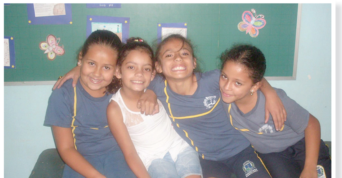
Participantes da exposição, meninas da turma do 3º C

O evento foi montado com bonecos, desenhos e dobraduras de papel. Também foi dividido em cinco painéis: Abertura da exposição; Revoada dos pássaros e personagens do livro; Estrelas do espaço e planetas visitados pelo Pequeno Príncipe; Mini quadros sobre o livro e borboletas interagindo com a obra.