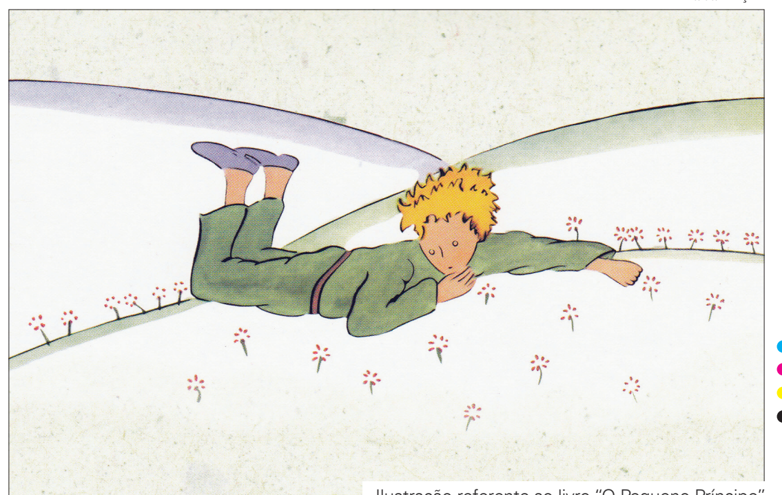
Ilustração referente ao livro “O Pequeno Príncipe”

suas viagens e demonstra uma grande sabedoria, assim ensina a personagem e o leitor sobre “o que é importante na vida”. O livro serviu de inspiração durante várias gerações. O Pequeno Príncipe já foi traduzido para 200 idiomas. No Brasil, segundo a editora Arte, a obra vende 300 mil exemplares por ano. Uma curiosidade: o personagem “o avião” representa o próprio autor da obra.