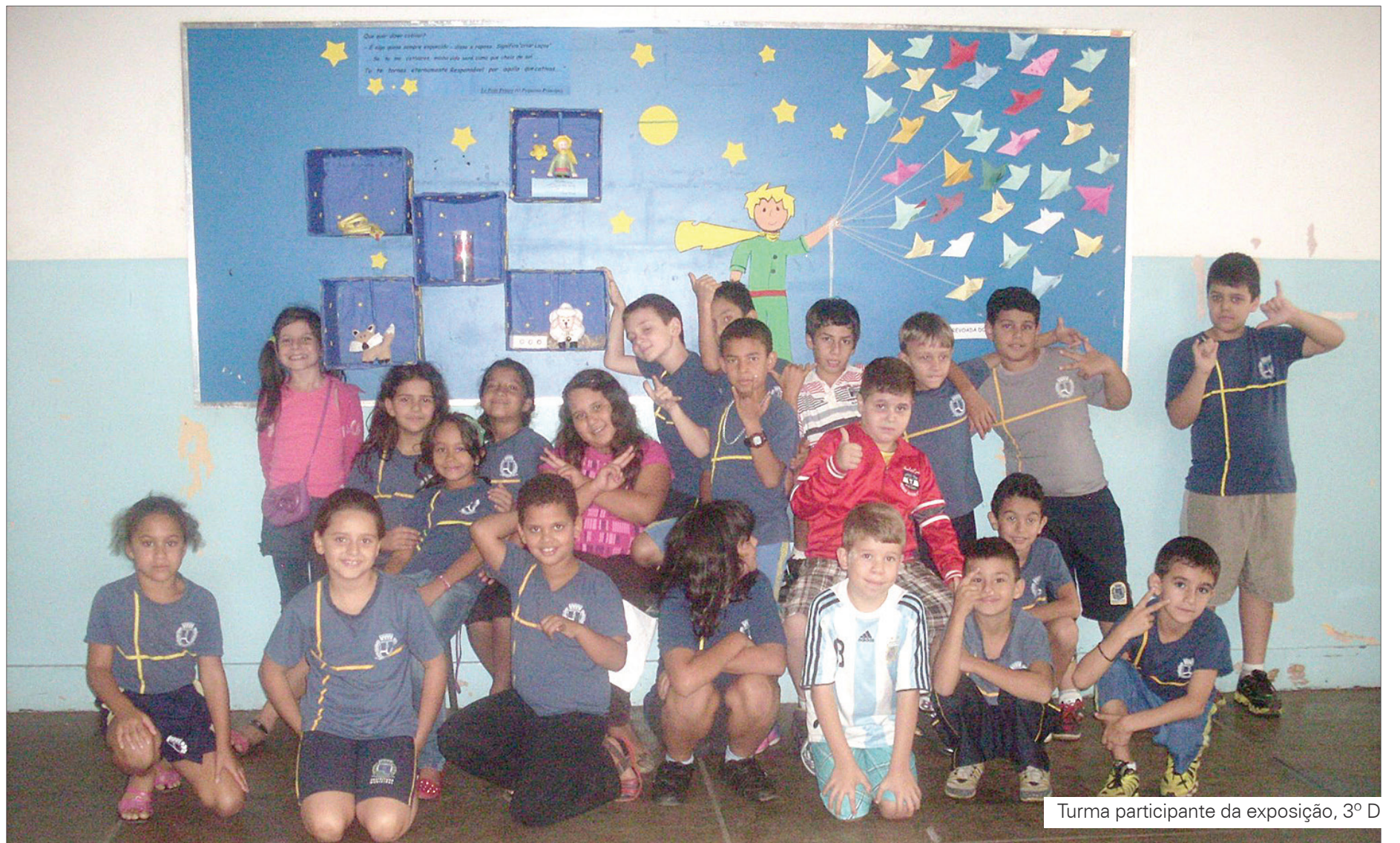
Turma participante da exposição, 3º D